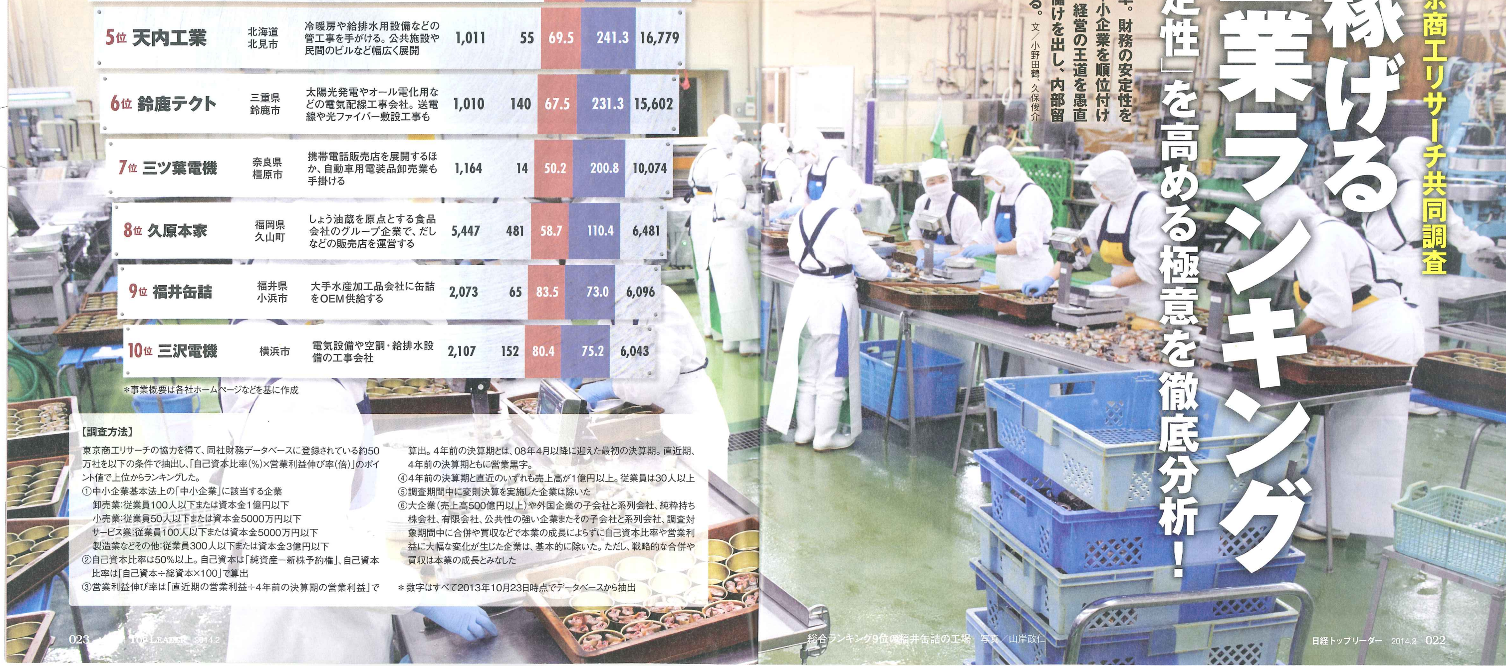
総合ランキング9位の福井缶詰の工場