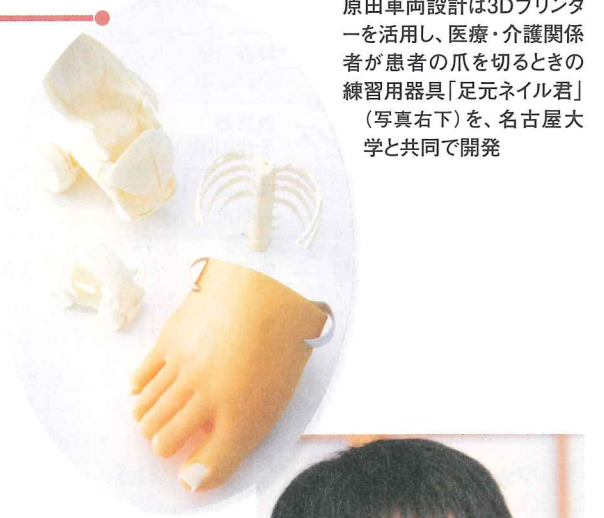
原田車両設計は3Dプリンタ ーを活用し、医療・介護関係 者が患者の爪を切るときの 練習用器具「足元ネイル君」 (写真右下)を、名古屋大 学と共同で開発